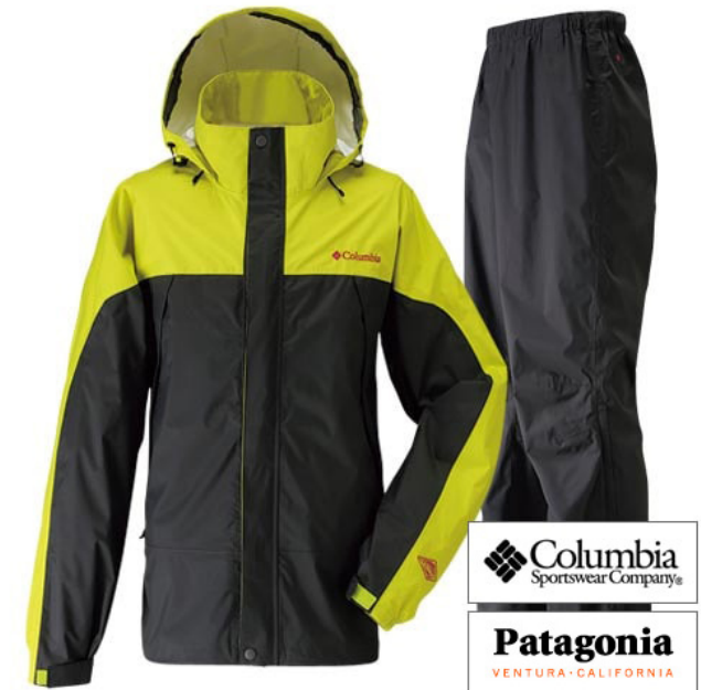
レインウェア活用法