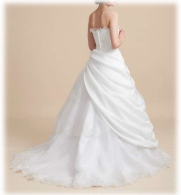
ESS-190 5T-13T (Basic Type)