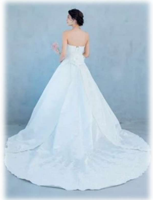
GD-164 5T-15T ($ 400-UP)