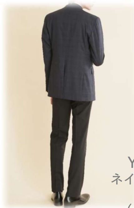
AU-60 YAS-BBM ネイビーブラック チェック ($200-UP)