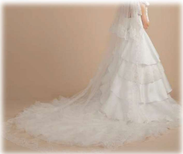
SULTRY-4F 9T-13T ($ 200- UP)