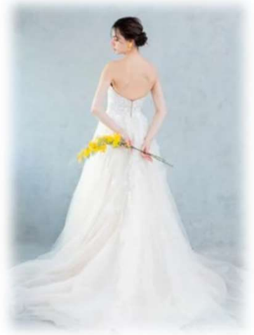
LUANA-3 5T-11T ($600-UP)