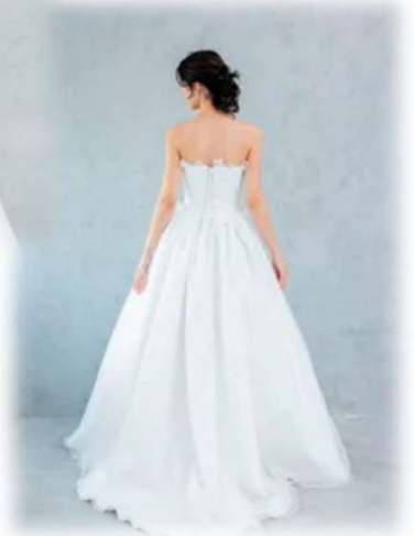
PIENO-3 5T-15T (Basic Type)