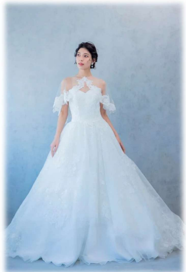
LUCIA 7T-13T ($ 500-UP)