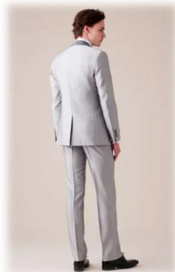
AIME YAS-BBM ライトグレー ($200-UP)