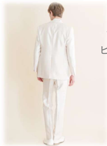
AU-53 YAS-BBLL ピンクホワイト ($ 100-UP)