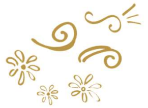
FLEUR 5T-11T ($ 500-UP)