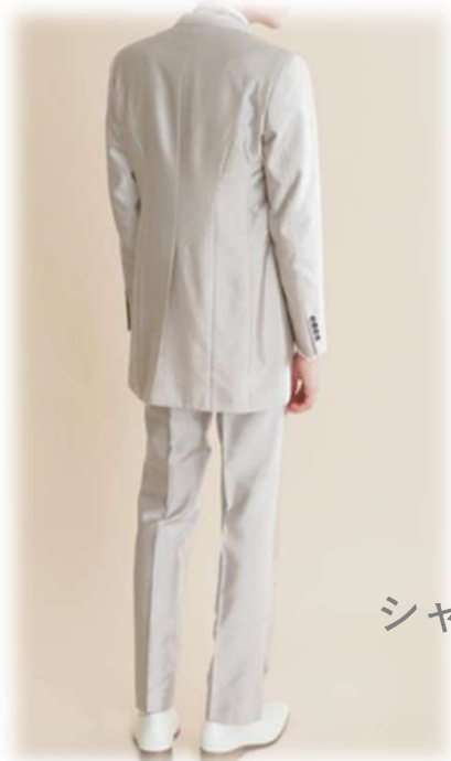
AU-61 YAS-BBLL シャンパンゴールド ($100-UP)