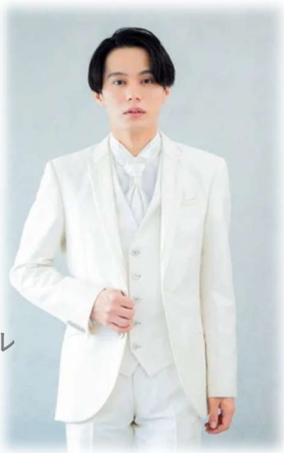
AU-59 YAM-BBLL ホワイト/パープル ($ 200-UP) ★リバーシブルベスト