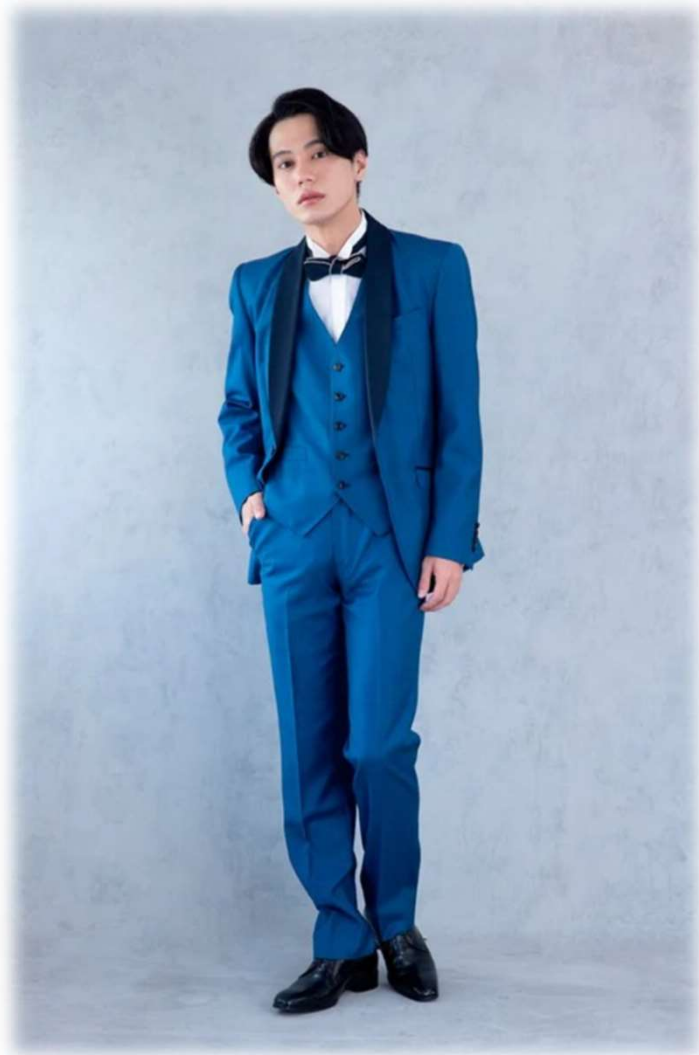
AU-62 YAS-BBLL ロイヤルブルー ($ 200-UP)