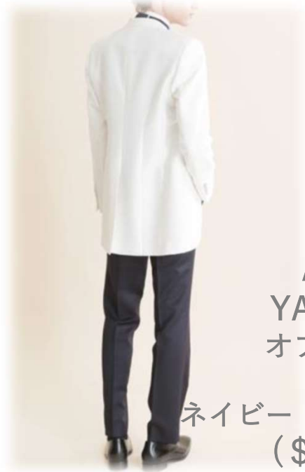
AU-64 YAS-BBLL オフホワイト × ネイビー (マリンカラー) ($ 300-UP)