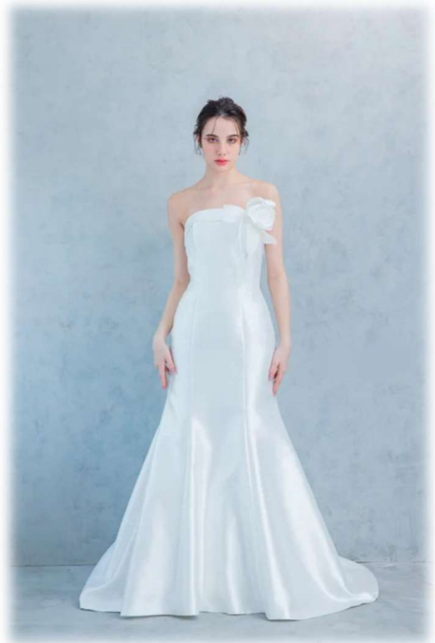
PIENO-2 5T-15T (Basic Type)