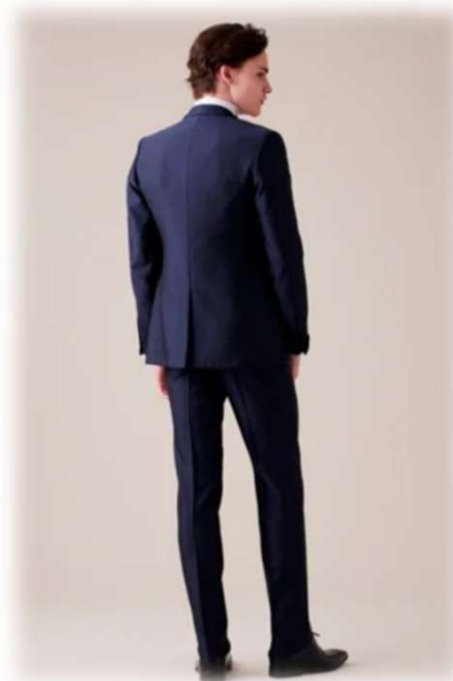
TIMEO AS-BBM ネイビー ($ 300-UP)