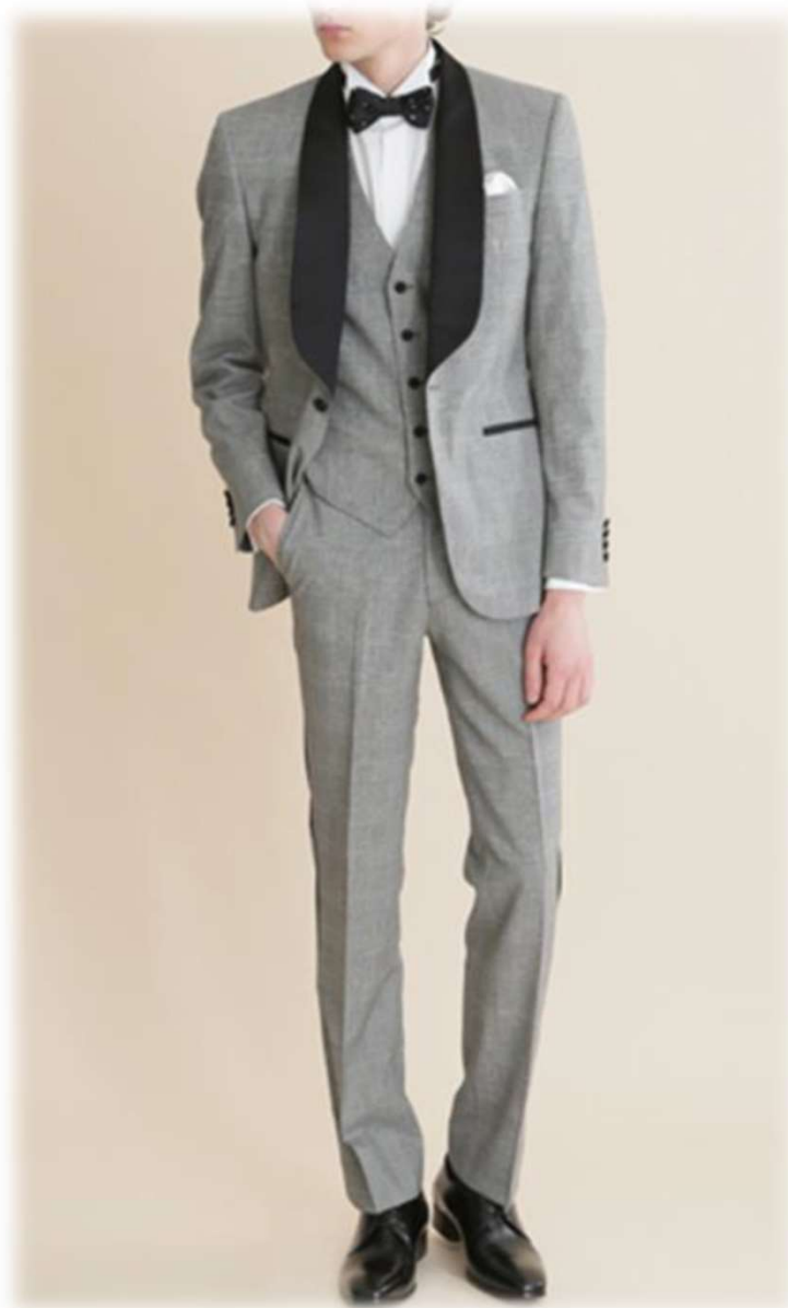
AU-63 YAS-BM グレンチェック ($ 300-UP)