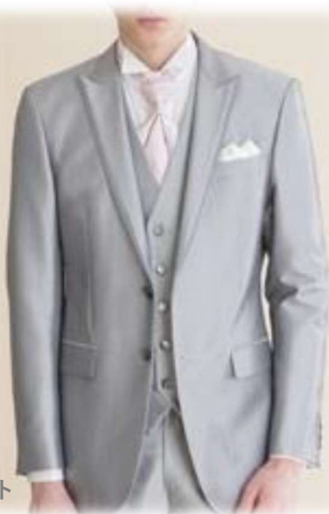
AU-57 YAS-BBL シルバー/ピンク ($100-UP)